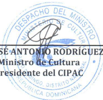
SR. JOSÉ ANTONIO RODRÍGUEZ Ministro de Cultura Presidente del CIPAC

Dada en la ciudad de Santo Domingo, Distrito Nacional, capital de la República Dominicana, a los veinticuatro (24) días del mes de enero del año dos mil catorce (2014).