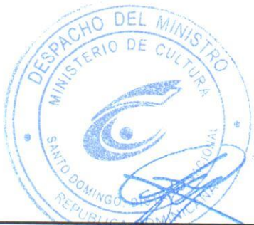
SR. JOSÉ ANTONIO RODRÍGUEZ Ministro de Cultura Presidente del CIPAC

Dada en la ciudad de Santo Domingo, Distrito Nacional, capital de la República Dominicana, a los veintitrés (29) días del mes de enero del año dos mil Catorce (2014).