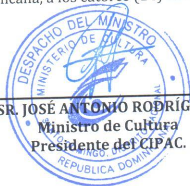
SR. JOSÉ ANTONIO RODRÍGUEZ Ministro de Cultura Presidente del CIPAC.

Dada en la ciudad de Santo Domingo, Distrito Nacional, capital de la República Dominicana, a los catorce (14) día del mes de abril del año dos mil catorce (2014).