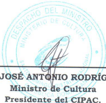
SR. JOSÉ ANTONIO RODRÍGUEZ Ministro de Cultura Presidente del CIPAC.

Dada en la ciudad de Santo Domingo, Distrito Nacional, capital de la República Dominicana, a los veintinueve (29) días del mes de agosto del año dos mil catorce (2014).