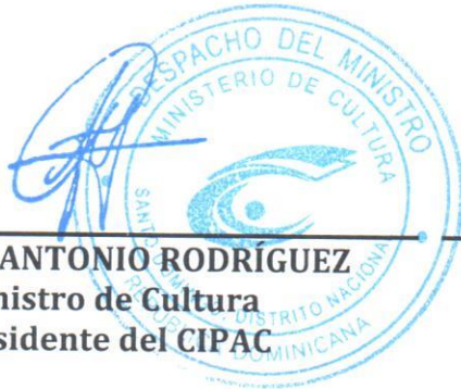
SR. JOSÉ ANTONIO RODRÍGUEZ Ministro de Cultura Presidente del CIPAC

Dada en la ciudad de Santo Domingo, Distrito Nacional, capital de la República Dominicana, a los quince (15) días del mes de agosto del año dos mil catorce (2014).