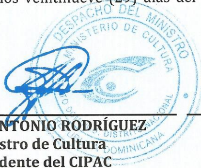
SR. JOSÉ ANTONIO RODRÍGUEZ Ministro de Cultura Presidente del CIPAC

Dada en la ciudad de Santo Domingo, Distrito Nacional, capital de la República Dominicana, a los veintinueve (29) días del mes de agosto del año dos mil Catorce (2014).