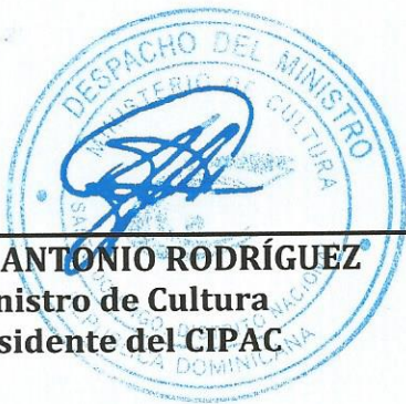
SR. JOSÉ ANTONIO RODRÍGUEZ Ministro de Cultura Presidente del CIPAC

Dada en la ciudad de Santo Domingo, Distrito Nacional, capital de la República Dominicana, a los veintinueve (29) días del mes de agosto del año dos mil Catorce (2014).