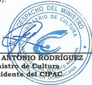
SR. JOSÉ ANTONIO RODRÍGUEZ Ministro de Cultura Presidente del CIPAC

Dada en la ciudad de Santo Domingo de Guzmán, Distrito Nacional, capital de la República Dominicana, a los dos (02) días del mes de diciembre del año dos mil catorce (2014).