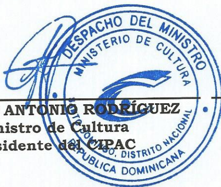
SR. JOSÉ ANTONIO RODRÍGUEZ Ministro de Cultura Presidente del CIPAC

Dada en la ciudad de Santo Domingo de Guzmán, Distrito Nacional, capital de la República Dominicana, a los dieciséis (16) días del mes de diciembre del año dos mil catorce (2014).