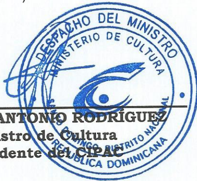
SR. JOSÉ ANTONIO RODRÍGUEZ Ministro de Cultura Presidente del CIPAC

Dada en la ciudad de Santo Domingo de Guzmán, Distrito Nacional, capital de la República Dominicana, a los dieciséis (16) días del mes de diciembre del año dos mil catorce (2014).