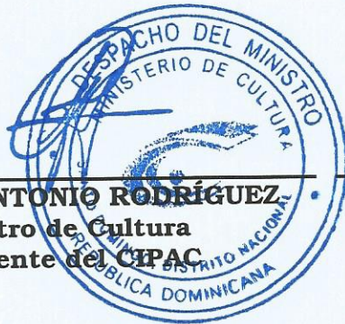
SR. JOSÉ ANTONIO RODRÍGUEZ Ministro de Cultura Presidente del CIPAC

Dada en la ciudad de Santo Domingo de Guzmán, Distrito Nacional, capital de la República Dominicana, a los dieciséis (16) días del mes de enero del año dos mil quince (2015).