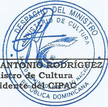
SR. JOSÉ ANTONIO RODRÍGUEZ Ministro de Cultura Presidente del CIPAC

Dada en la ciudad de Santo Domingo de Guzmán, Distrito Nacional, capital de la República Dominicana, a los veintinueve (29) días del mes de enero del año dos mil quince (2015).