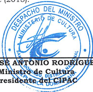
SR. JOSÉ ANTONIO RODRÍGUEZ Ministro de Cultura Presidente del CIPAC

TERCERO: NOTIFICAR la presente Resolución al Ministerio de Hacienda y a la Dirección General de Impuestos Internos (DGII) de conformidad al procedimiento establecido en el Reglamento de Aplicación No. 370-11 de la Ley No. 108-10. Dada en la ciudad de Santo Domingo de Guzmán, Distrito Nacional, capital de la República Dominicana, a los diecisiete (17) días del mes de febrero del año dos mil quince (2015).