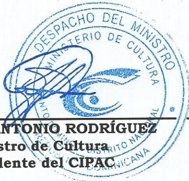
SR. JOSÉ ANTONIO RODRÍGUEZ Ministro de Cultura Presidente del CIPAC

Dada en la ciudad de Santo Domingo de Guzmán, Distrito Nacional, capital de la República Dominicana, a los veinte (20) días de agosto del año dos mil quince (2015).