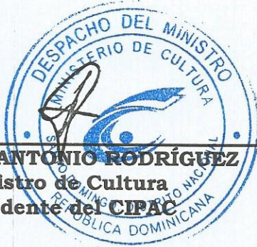
SR. JOSÉ ANTONIO RODRÍGUEZ Ministro de Cultura Presidente del CIPAC

Dada en la ciudad de Santo Domingo de Guzmán, Distrito Nacional, capital de la República Dominicana, a los doce (12) días del mes de noviembre del año dos mil quince (2015).