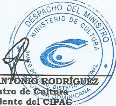
SR. JOSÉ ANTONIO RODRÍGUEZ Ministro de Cultura Presidente del CIPAC

Dada en la ciudad de Santo Domingo de Guzmán, Distrito Nacional, capital de la República Dominicana, a los doce (12) días del mes de noviembre del año dos mil quince (2015).