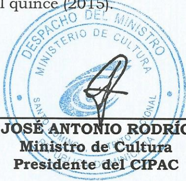
SR. JOSÉ ANTONIO RODRÍGUEZ Ministro de Cultura Presidente del CIPAC

Dada en la ciudad de Santo Domingo de Guzmán, Distrito Nacional, capital de la República Dominicana, a los veinticinco (25) días del mes de noviembre del año dos mil quince (2015).