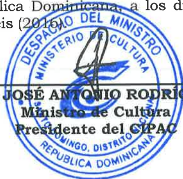
SR. JOSÉ ANTONIO RODRÍGUEZ Ministro de Cultura Presidente del CIPAC

Dada en la ciudad de Santo Domingo de Guzmán, Distrito Nacional, capital de la República Dominicana, a los diez (10) días del mes de febrero del año dos mil dieciséis (2016).