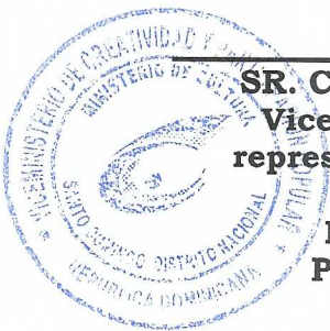
SR. CAYO CLAUDIO ESPINAL, Viceministro de Cultura en representación del SR. PEDRO VERGES Ministro de Cultura Presidente del CIPAC

Dada en la ciudad de Santo Domingo de Guzmán, Distrito Nacional, capital de la República Dominicana, a los veintitrés (23) días del mes de marzo del año dos mil dieciocho (2018) .