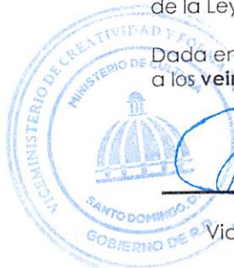
GIOVANNY CRUZ DURÁN Viceministro de Cultura, en representación de la Ministra de Cultura Presidente del CIPAC

Dada en la ciudad de Santo Domingo de Guzmán, Distrito Nacional, capital de la República Dominicana, a los veintitrés (23) días del mes de febrero del año dos mil veinticuatro (2024) .