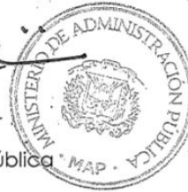
Darío Castillo Lugo Ministro de Administración Pública

Refrendado por el Ministerio de Administración Pública (MAP)